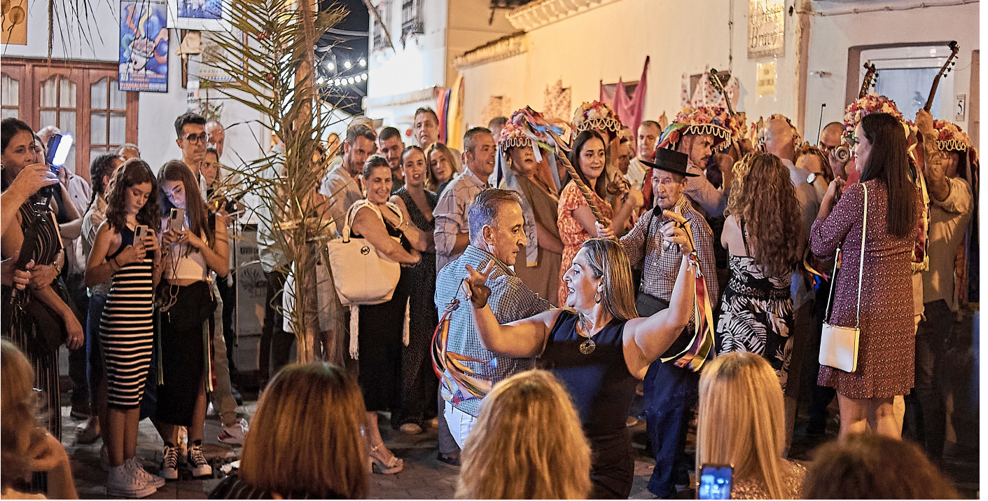
Fotografía de Juan Ortiz Rivas, ganadora del 6º Concurso fotográfico de "Málaga Monumental" tomada en Benagalbón