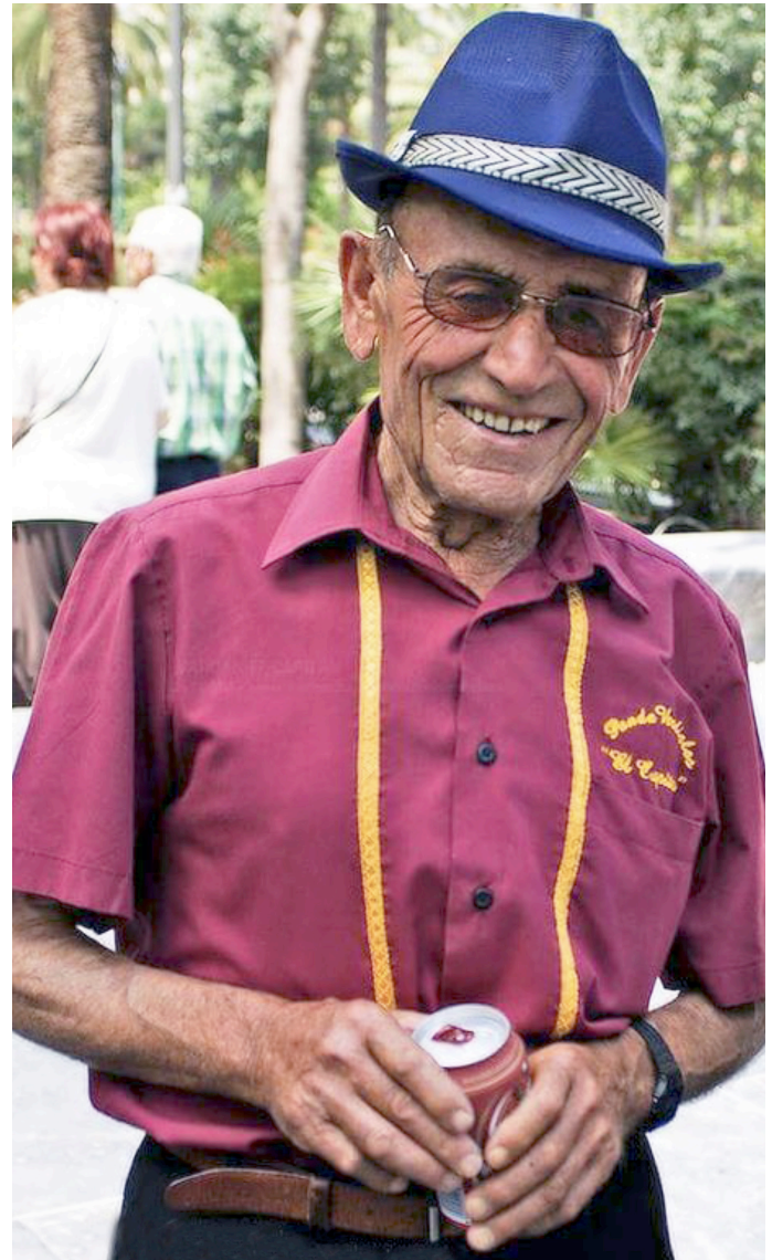
19 junio 2011